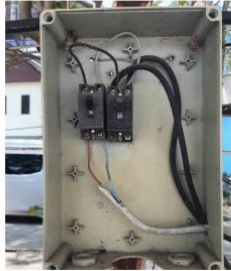
ภาพที่ 3 เบรกเกอร์ควบคุมการเปิดปิดของวงจรไฟฟ้า ของสถานจอดรถ ที่สมควรได้รับการปรับปรุงให้ปลอดภัยมากกว่านี้

2.1.3. (จากประเด็น 2.1.1) หอภาพยนตร์ควรให้ความสำคัญกับความปลอดภัยของระบบไฟฟ้าให้ตรงกัมาตรฐานกว่านี้ : ควรติดตั้งอุปกรณ์ของระบบไฟฟ้าที่มีมาตรฐานมากกว่านี้จากสภาพที่เป็นอยู่ตามภาพที่ 3 เช่น ควรติดตั้งระบบสายดิน หรืออย่างน้อยก็ควรติดตั้งเบรกเกอร์ป้องกันไฟดูด เนื่องจากระบบไฟฟ้าไม่มีการติดตั้งสายดิน