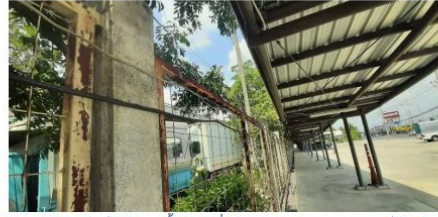
ภาพที่ 1 และ 2 การพันสายไฟ 220 V เอาไว้กับรั้วเหล็กด้วย Cable tie หรือบางบริเวณใช้ลวดผู่อำไว้กับแนวรั้ว พักที่สถานจอดรถของหอภาพยนตร์ ติดกับฝั่งรั้วของวิทยาลัยนาฏศิลป์ เห็นสมควรว่าควรติดตั้งใหม่ มีการร้อยท่อสายไฟให้ถูกต้องตามหลักวิศวกรรมไฟฟ้า

2.1.3. (จากประเด็น 2.1.1) หอภาพยนตร์ควรให้ความสำคัญกับความปลอดภัยของระบบไฟฟ้าให้ตรงกัมาตรฐานกว่านี้ : ควรติดตั้งอุปกรณ์ของระบบไฟฟ้าที่มีมาตรฐานมากกว่านี้จากสภาพที่เป็นอยู่ตามภาพที่ 3 เช่น ควรติดตั้งระบบสายดิน หรืออย่างน้อยก็ควรติดตั้งเบรกเกอร์ป้องกันไฟดูด เนื่องจากระบบไฟฟ้าไม่มีการติดตั้งสายดิน