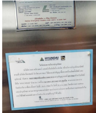
ภาพที่ 5 ใบรับรองการบริการบำรุงรักษาครั้งล่าสุดของลิฟต์ด้านซ้ายของอาคารสรรพาศรศุกกิจ ซึ่งหมดวาระไปแล้วตั้งแต่ปีงบประมาณ พ.ศ. 2564 (ตามสัญญาเลขที่ 65/2564)

2.3. ประเด็นวาระการตรวจสอบมาตรฐานลิฟต์ที่หมดอายุแล้ว ขัดต่อมาตรฐานตามกฎหมาย : ตามภาพที่ 5 ข้าพเจ้าสังเกตว่าลิฟต์ฝั่งซ้ายมือของอาคารสรรพาศรศุกกิจ (เมื่อหันหน้าเข้าลิฟต์) จะพบว่าภายในลิฟต์จะมีการแจ้งใบรับรองการบริการบำรุงรักษาครั้งล่าสุดโดยบริษัทเอกชนแห่งหนึ่งติดประกาศเอาไว้ที่ลิฟต์ ซึ่งหมดวาระไปตั้งแต่สิ้นปีงบประมาณ 2564 แล้ว(ตามสัญญาเลขที่ 65/2564) และลิฟต์ดังกล่าวยังไม่มีการบริการบำรุงรักษาต่ออีกเลยจนกระทั่งปัจจุบันเป็นเวลา 906 วัน