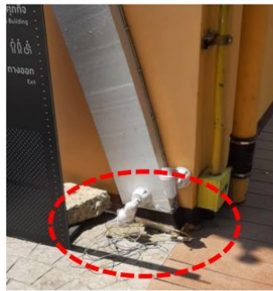
ภาพที่ 4 สภาพสายไฟที่กรงบริเวณพื้นถนน พักอาคารเหลือง ภาพยนตร์เสียงศรีกรุง (ตามวงรีเส้นปะสีแดง)

2.2. ประเด็นสายไฟฟ้าที่อาคารเหลือง (อาคารภาพยนตร์เสียงศรีกรุง) ที่มีสายไฟกรงบริเวณพื้นอาคาร ตามภาพที่ 4 ซึ่งข้าพเจ้าไม่แน่ใจว่าทางหน่วยอาคารสถานที่ได้ทำการตัดระแแสไฟให้ออกจากสายไฟเส้นนี้หรือยัง? ข้าพเจ้ามีความคิดเห็นว่าจะควรจะมีการเก็บสายไฟให้เรียบร้อย ป้องกันบุคคลที่เดินผ่านไปมาอาจเดินไปสะดุดได้