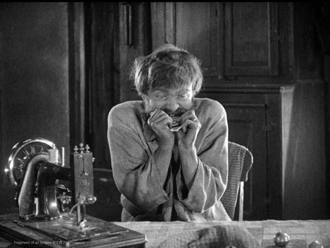
Fragment of an Empire