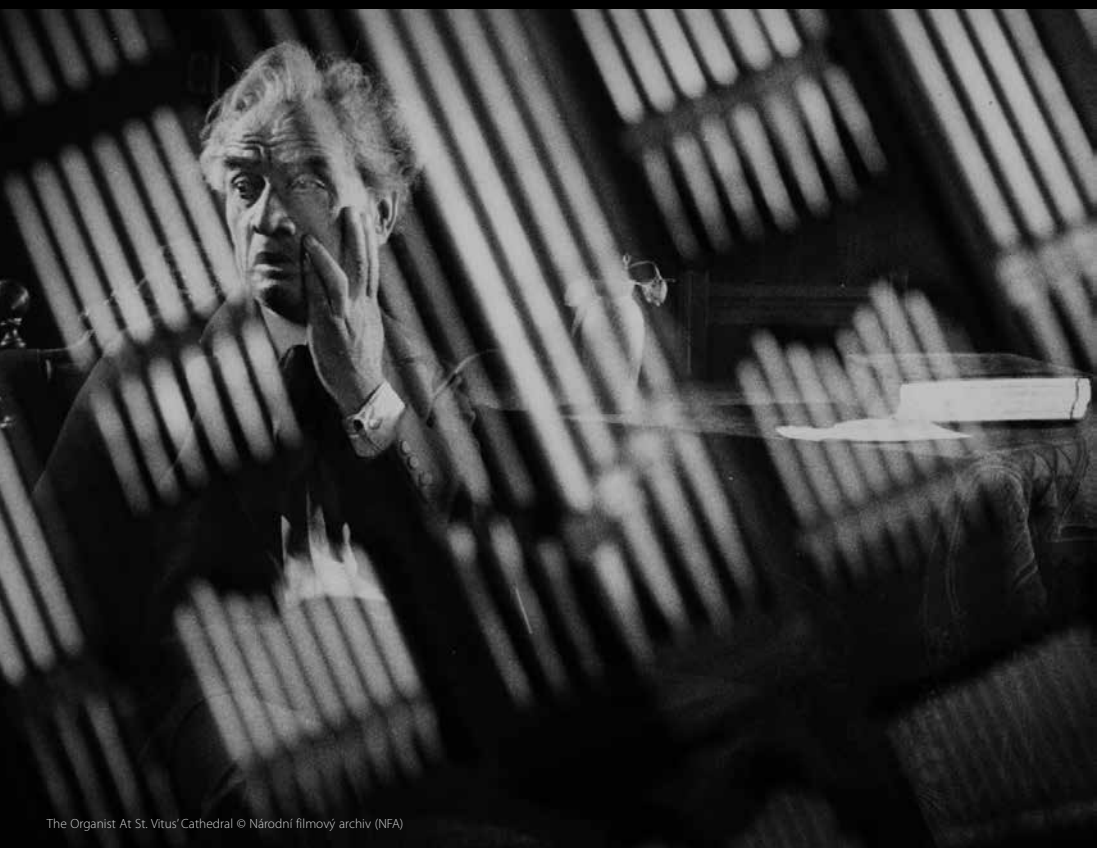
The Organist At St. Vitus' Cathedral