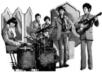
ภาพยนตร์เรื่อง “สวนสน”

มองซิมองทะเล เห็นลมคลื่นแห่งจูบหิน บางครั้งมันบ้าบิ่น กระแทกหินดั่งครืนครืน ทะเลไม่เคยหลับไหล ใครตอบได้ไหมเอนจิงตื่น บางครั้งยังสะอื้น ทะเลมันตื่นอยู่ร่ำไป ทะเลหัวใจของเรา แผงเอารักแอบเข้าไว้ ดูซิเป็นไปได้อื่นใจเหมือนดังทะเลครวญ ยามหลับไหลชั่วคืน ก็ถูกคลื่นฝันปลุกฉันทัญจวน ใจรักจึงเรรวน มิเคยจะหลับเหมือนกับทะเล ทะเลหัวใจของเรา แผงเอารักแอบเข้าไว้ ดูซิเป็นไปได้อื่นใจเหมือนดังทะเลครวญ ยามหลับไหลชั่วคืน ก็ถูกคลื่นฝันปลุกฉันทัญจวน ใจรักจึงเรรวน มิเคยจะหลับเหมือนกับทะเล