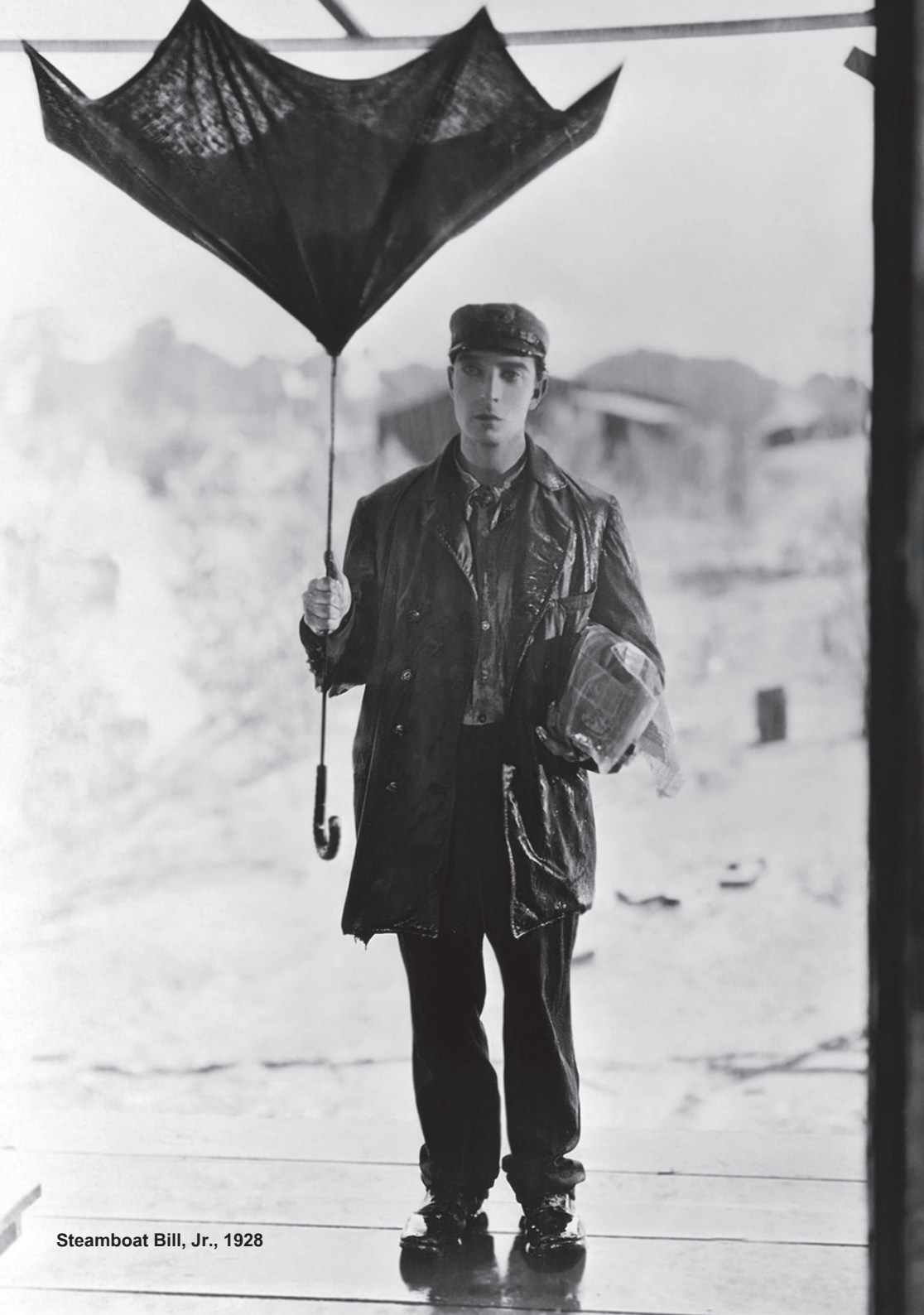
Steamboat Bill, Jr., 1928